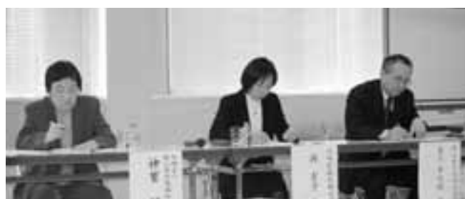
コーディネーターの先生方

今回の発表会では、新たな試みとして、パネルディスカッションの実施と参加者の投票及びコーディネーターの審査で2部門の表彰を行いました。